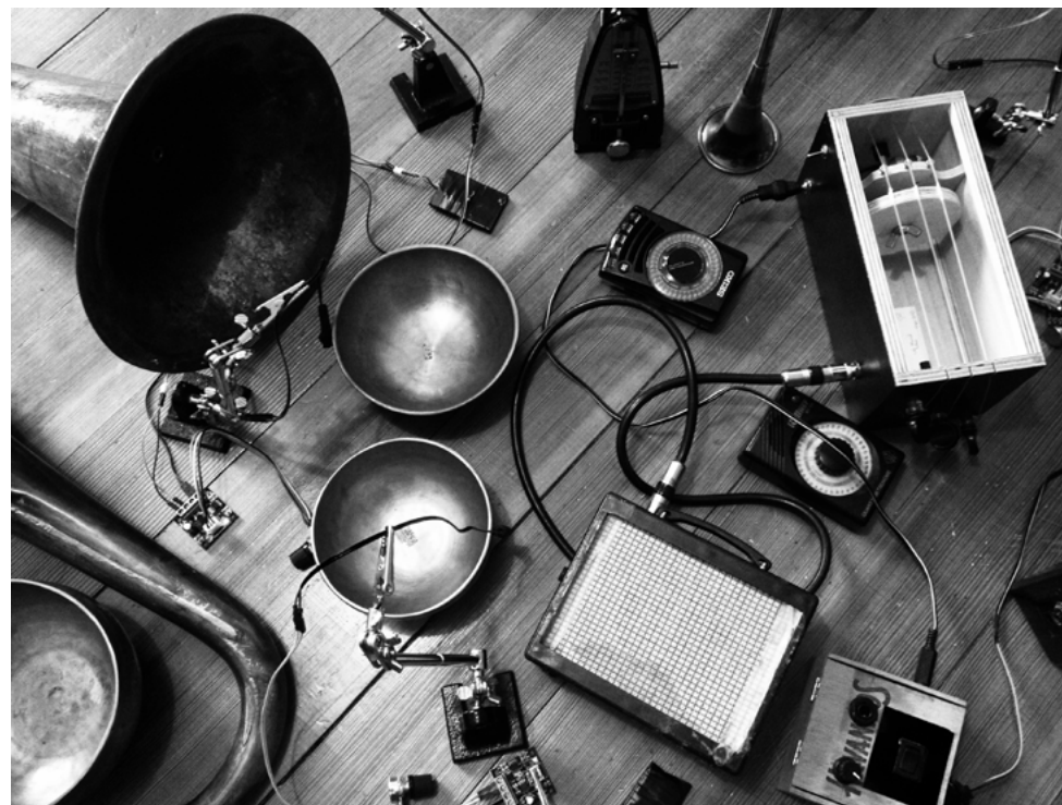
Objets sonores utilisés par La Tremblaine

L'enjeu est de pouvoir construire des mondes imaginaires, des utopies, inspirés des pistes de réflexions récoltées qui prendront la forme d'œuvres sonores regroupant chants, voix parlées et sons d'objets. Celles-ci seront enregistrées et regroupées sur un support audio avec une édition des textes sous forme d'un livre objet.