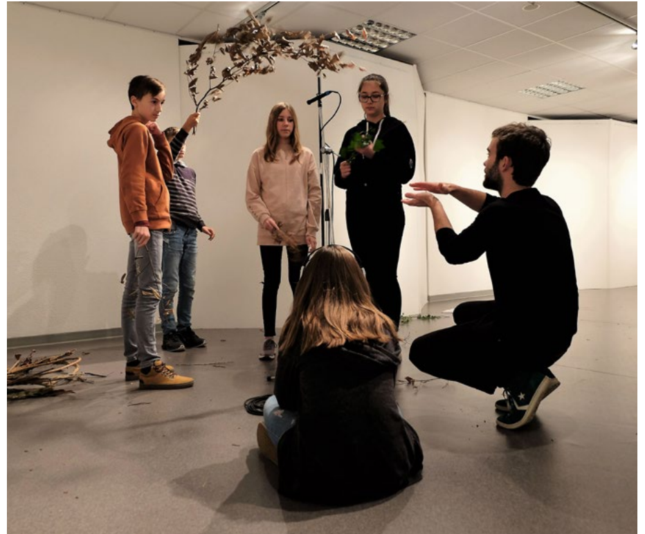
Quand une oeuvre s'anime, 2019 enregistrements extérieurs et récolte de matériaux enregistrés ensuite en studio mobile