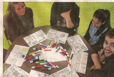
Pour mettre les jeunes dans l'ambiance, l'atelier a débuté jeudi, par de simples dessins improvisés sur de la musique.

Après une annulation faute de troupes (et de discipline) l'an dernier, l'atelier Hiero de dessins sonores a finalement trouvé son public au Centre culturel Europe, jeudi et hier. Un groupe de quatre à huit jeunes a appris à créer des sons en dessinant, grâce à un micro piezo branché sur leur feutre, et à mixer les sons créés, grâce à un contrôleur MIDI, qui permet de répéter le son, de le faire résonner ou de l'harmoniser. « On se croirait dans un rêve, on entend des bruits chelous » juge Ebru, 13 ans, en se tenant le casque sur les oreilles tandis que sa