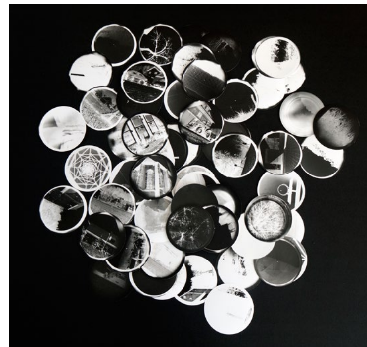
Fragments sonores des mémoires humaines, 2019 création d'une édition regroupant des textes et des photos de sténopé réalisées collectivement