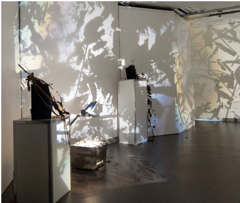
Quand une oeuvre s'anime, 2019 installation sonore (pièce électro-acoustique et texte) et immersion visuelle