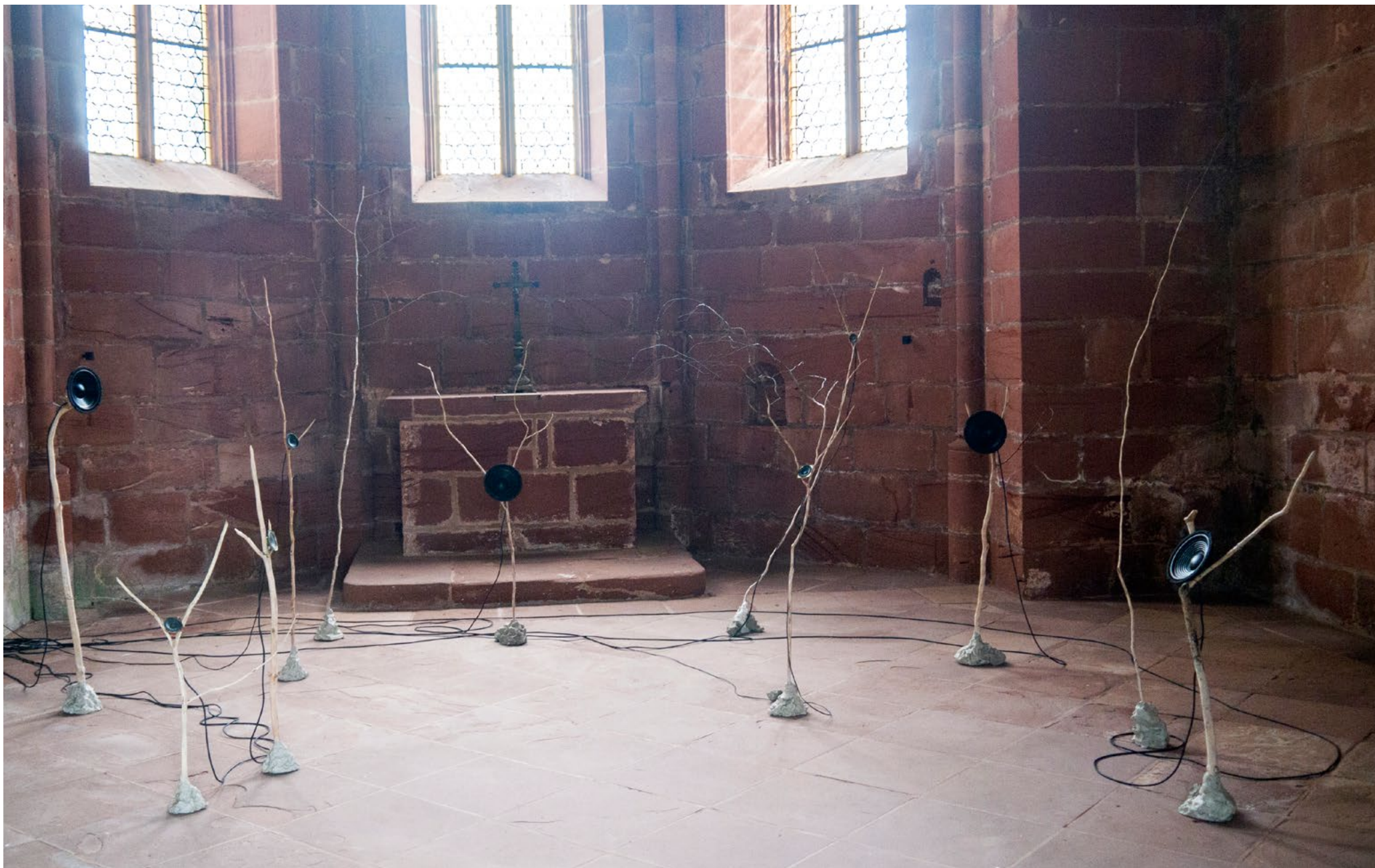
Fragments sonores des mémoires humaines, 2019 installation sonore finale réalisée dans la chapelle du Château du Lichtenberg