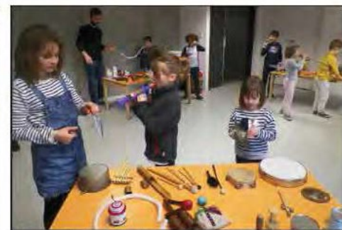
Les enfants découvrent la variété des instruments qui leur serviront à composer leur partition.