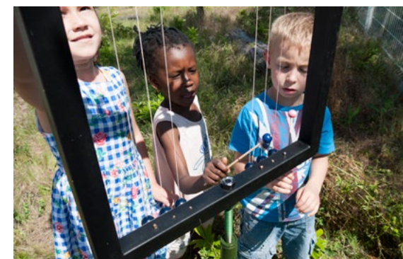
Résidence-mission APAP/Kunsthalle, 2018 arbre et autres sculptures sonores installées dans la cour de l'école et activés par les enfants