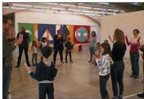
Petit échauffement avant de débiter l'atelier en découvrant ensemble le rythme des sons.

C'est l'art sous toutes ses formes et ses expressions que propose de découvrir, ce week-end, la Kunsthalle, à Mulhouse, avec en particulier, hier, un atelier famille très partagé.