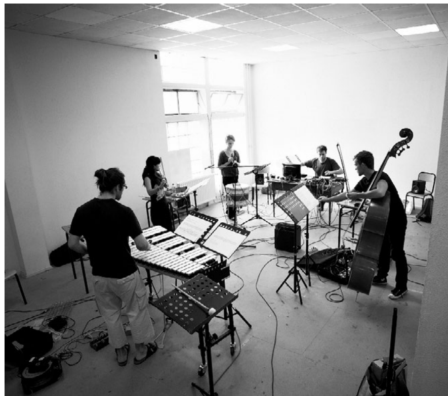
L'ensemble HANATSUmiroir en répétition

Ces propositions sont encore provisoires et plusieurs autres artistes pourraient y être associés.