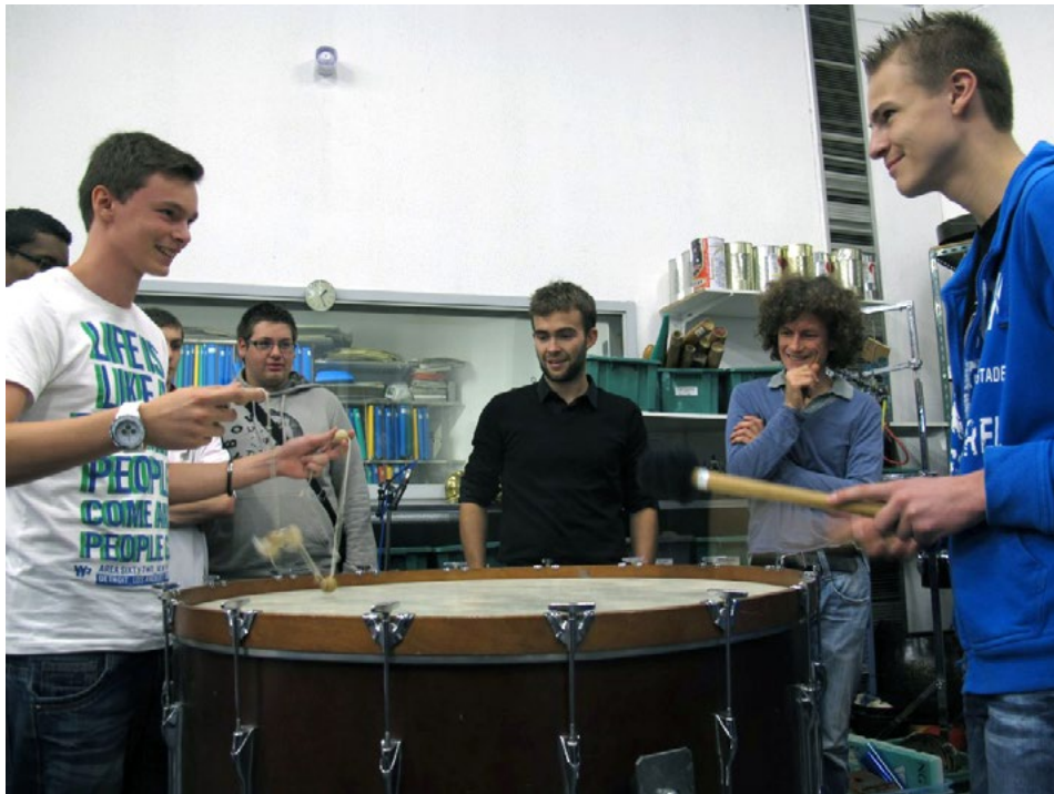
Atelier de la création, 2013 expérimentations sonores dans les locaux des percussions de Strasbourg

Cet atelier propose de s'inspirer de son environnement sonore quotidien afin de créer une/des pièces sonores en utilisant l'outil informatique. Les recherches passent par l'écoute, la co-construction de cartes sensibles, le partage d'expériences du quotidien, l'enregistrement, le montage sur logiciel, la composition électro-acoustique. Il peut s'adresser à différents groupes de personnes, enfants et adultes.