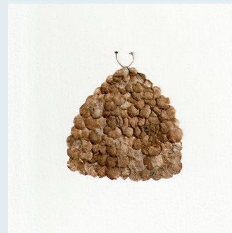
Refuges de La Tremblaie

à écouter sur la plateforme bandcamp : dreieckinterferences.bandcamp.com/album/refuges