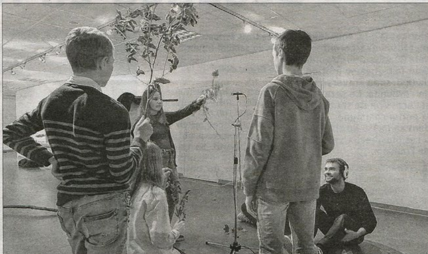
Un studio mobile, véritable laboratoire d'expérimentations sonores, a été créé pour l'occasion au sein du collège des Avrils à Saint-Mihiel.

Un groupe d'élèves de 4 e du collège des Avrils a levé le voile la semaine passée sur une création artistique originale, en partenariat avec le Vent des Forêts. La présentation de cette installation acoustique et visuelle faisait suite aux recherches, menées depuis novembre, avec le plasticien sonore alsacien, Stéphane Clor.